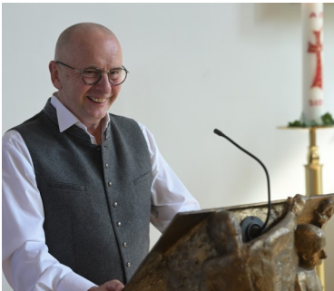
3. Bürgermeister Ewald Straßer