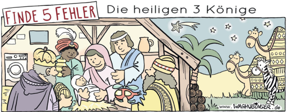
Waschmaschine, Kürbis, Hubschrauber, Seestern, Zebra